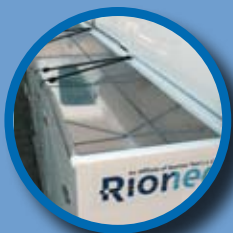
Aluminium gereedschapskist met slangbak