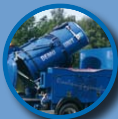
Aluminium of RVS zuigtanks