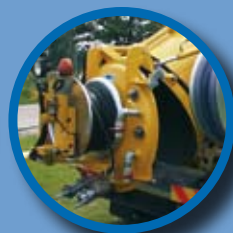
Hydraulisch achterdeksel met hydraulische knevels